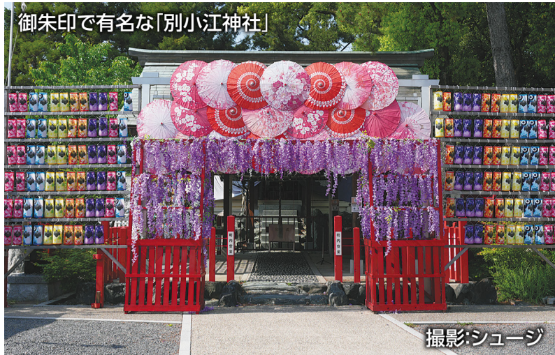
御朱印で有名な「別小江神社」