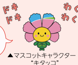
▲マスコットキャラクター「キタッコ」

愛知国際アリーナでは、柔道、バスケットボール、車いすバスケットボールが実施されます!