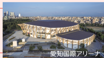
愛知国際アリーナ

北区が注目される チャンス と 民の力 を生かして区の魅力向上や情報発信に力を入れていきます!