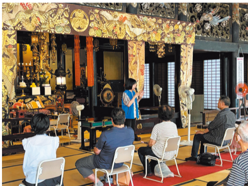
「建中寺」御霊屋ガイドツアー ※写真は昨年の様子

「文化のみち」をPRするため、令和7年度に国の重要文化財に指定された「建中寺」にて、通常は非公開である施設の特別公開イベントを実施するとともに、Instagramを活用して、幅広い世代に東区の歴史・文化の魅力を発信し、関心を持つ方の裾野を広げます。