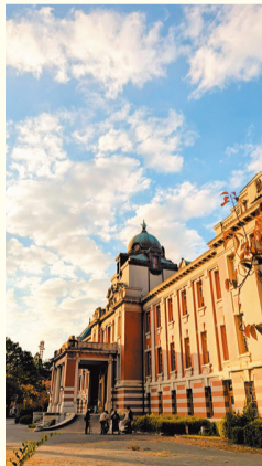
名古屋市市政資料館