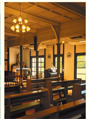
カトリック主税町教会