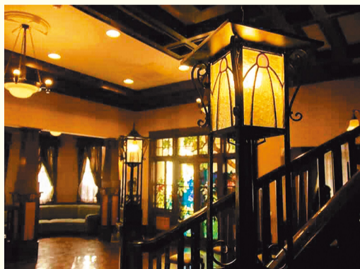
文化のみち二葉館