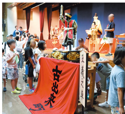
子ども山車まつり教室 ※写真は昨年の様子

東区には、筒井町と出来町に伝統の5輿の山車があります。山車文化の魅力を特に若い世代に向けて発信し、東区の山車文化への関心を高め、次世代への継承を支援すべく、「子ども山車まつり教室」などの各種事業を行います。