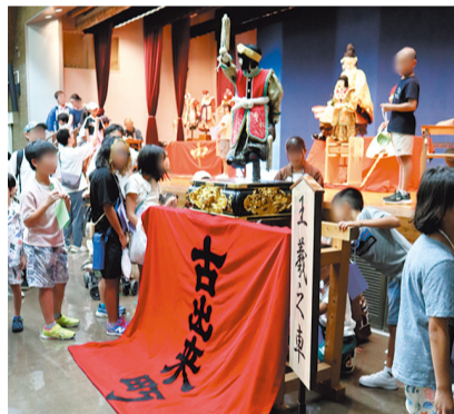
子ども山車まつり教室 ※写真は昨年の様子

東区には、筒井町と出来町に伝統の5輦の山車があります。山車文化の魅力を特に若い世代に向けて発信し、東区の山車文化への関心を高め、次世代への継承を支援すべく、「子ども山車まつり教室」などの各種事業を行います。