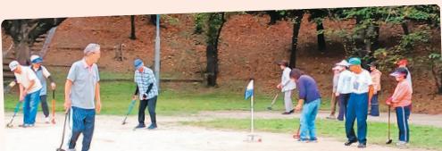
■グラウンドゴルフ

健康長寿には「外に出て 人に関わる」も秘訣の一つです。 皆さんのご参加をお待ちしています！