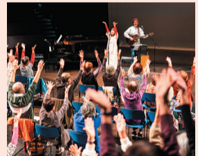
フレイル講演会(つるかめセミナー)