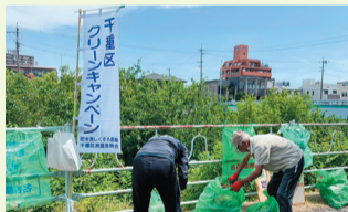
グリーンキャンペーン