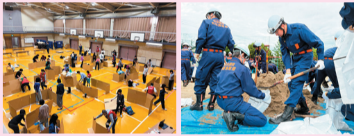
ちくさ子ども防災キャンプ 総合水防訓練