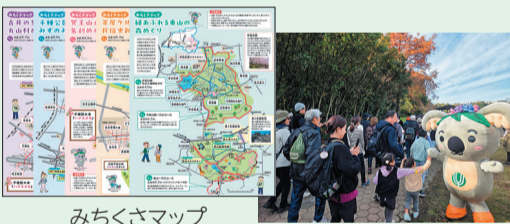
みちくさマップ ジョギング・ウォーキング大会