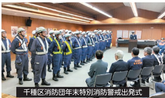
千種区消防団年末特別消防警戒出発式

問合 警察署 ☎753-0110 FAX753-0221 区役所地域力推進課 ☎753-1821 FAX753-1924