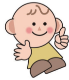
名古屋子どもの権利条例マスコットキャラクター「なごっちゃん」

地域での子育て支援や児童虐待の予防活動を学ぶ。①7/28(火)②8/24(月)③9/4(金)午後2:00～4:00 名古屋子どもの権利条例マスコットキャラクター「なごっちゃん」 テーション(中区)②南区役所③西区役所 各30人程度。託児要相談。受7/24(金)②8/20(木)③8/31(月)必着。市ウェブサイト ☎1009350 区子ども家庭支援センターさくら ☎821-7867 📠821-7869(子ども青少年局子ども福祉課) ☎972-3979 📠972-4438