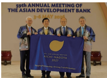
今年ウズベキスタンで開催された年次総会の様子

アジア開発銀行はアジア・太平洋地域の貧困削減や持続可能で包摂的な経済発展を支援する国際開発金融機関です。年次総会では加盟する国・地域の財務大臣・中央銀行総裁などが一堂に会し、開発上の課題について議論します。来年5/2(日)～5(水・祝)に本市で開催されます。