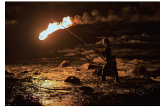
前回の最優秀作品「馬瀬川上流鮎 火ぶり漁」

木曽三川流域の魅力を伝える写真を募集 受10/31(土)まで 問上下水道局連携推進課 ☎972-3720 F961-0276