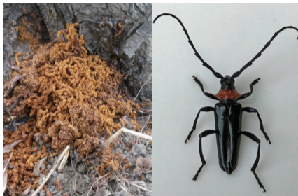
幼虫が出す木くずと成虫

サクラ・ウメ・モモなどに寄生して枯らしてしまう「クビアカツヤカミキリ」の被害が広がっています。幼虫が出す木くずや成虫を見かけたらご連絡ください 市ウェブサイト Q1008794 問なごや生物多様性センター ☎831-8104 F839-1695