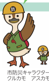
市防災キャラクター フルカモ アスカモ