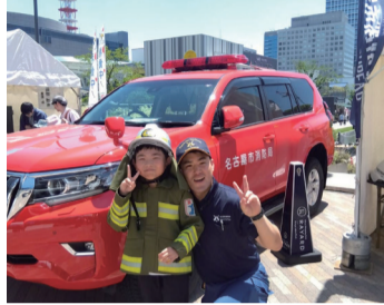
子ども用防火服を着て ちびっこ消防士になろう!