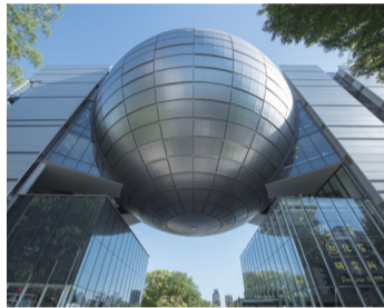
同公園内のFUJInagoya科学館の外壁で救助訓練を実施

問合せ 消防局総務課 ☎052-972-4260 FAX052-972-4195