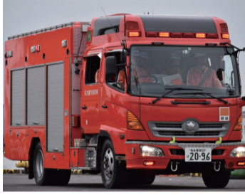
写真撮影ができる!