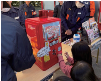
参加者に消防ノベルティをプレゼント!本部テントで受け付け