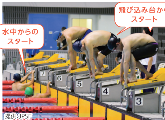
水中からの スタート