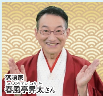
落語家 どうぶつ屋 春風亭昇太さん