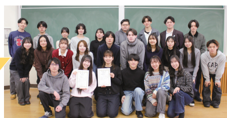
マップコンテストに参加した市内の大学生のみなさん

市内の大学生が同乗車券を使った旅のアイデアを考案! 「サイコロを使ったすごろく風の旅」「海外気分を感じられる旅」の2つのアイデアをマップ化します! お楽しみに♪