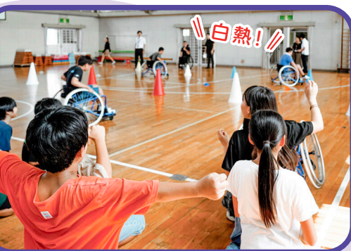
みんなでリレーをやってみた