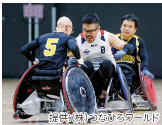
提供(株)つなひろワールド

答えは.....②と③ 障害の程度は人それぞれだから、 クラス分けでみんなが平等に試合をできる ようになっているよ! 車いすの操作技術などが大切で、男女の体格差を気にせずできるスポーツだよ。