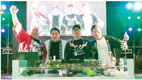
名古屋まつりのステージの様子(令和7年10月)

「和菓子をはじめとする日本の伝統文化をもっと身近に感じてほしい」という志を持った老舗和菓子店の若旦那たちが「アンコマン」と名乗り、DJとして名古屋まつりを盛り上げました。