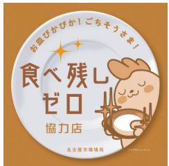
食べ残しゼロ協力店ステッカー

★食べきれない量だけ注文する★食べきれない料理は、お店に確認して持ち帰る★「食べ残しゼロ協力店」をホームページで確認しよう ☑市ウェブサイト ☑1012364 ☑環境局資源循環推進課 ☎972-2379 ☎972-4133