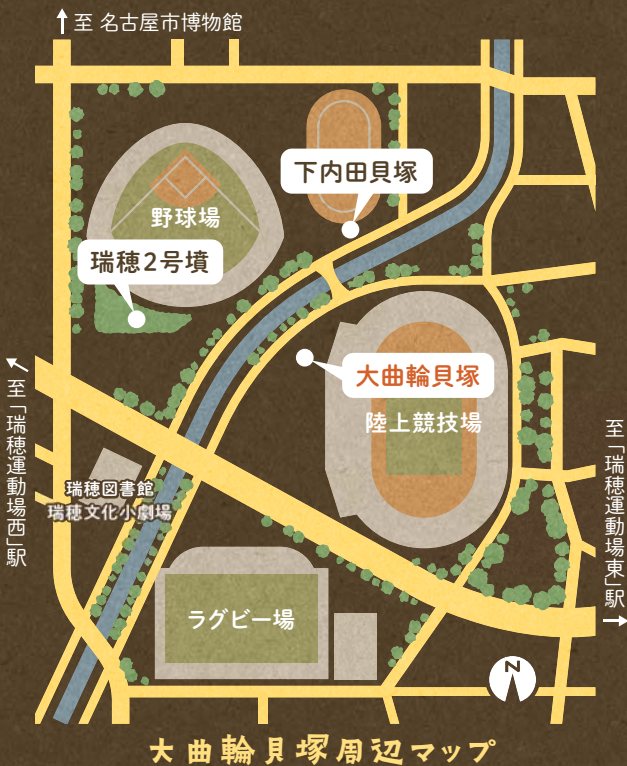
大曲輪貝塚周辺マップ

市営地下鉄名城線 「瑞穂運動場東」3番出口より西へ徒歩6分 市営地下鉄桜通線 「瑞穂運動場西」2番出口より東へ徒歩9分