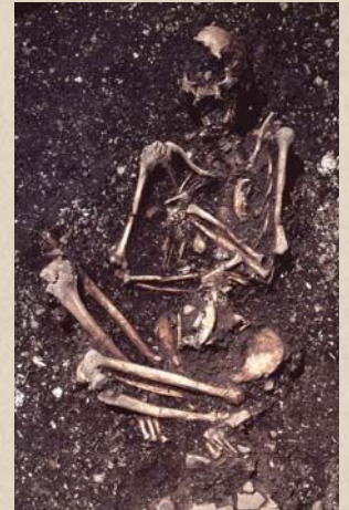
縄文人の人骨(晩期)

縄文時代、犬は猟犬として活躍しました。お墓の様子から、人が犬を大事にしていたことがわかります。