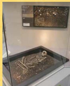
貝層の断面と縄文人の人骨

このコーナーでは、土器や石器からわかる〈縄文時代のくらし〉と、土偶などから推定される〈縄文時代のいのり〉について紹介しています。そのなかで、大曲輪貝塚(大曲輪遺跡)でみつかった土器、石器、土偶、埋葬された縄文人の人骨、貝層の断面などを展示しています。ぜひご覧ください!