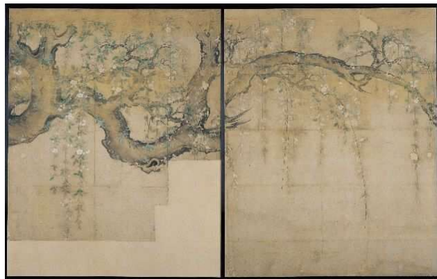
重要文化財 名古屋城本丸御殿障壁画「枝垂桜図」 注：IV期「春の花鳥」後期展示

★3月13日 金曜日から5月10日 日曜日 上御膳所障壁画「枝垂桜図」など、春の花や景色を描いた作品を紹介し ます。 なお、会期中に展示替えを行います。 展示状況は名古屋城ホームページをご覧ください。