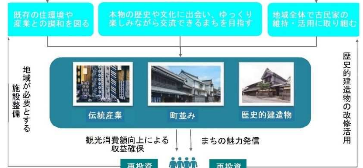
「有松地区における古民家を活かしたまちづくりの考え方」に基づく事業を展開

事業実施にあたっては、右図のような考えや実施体制のもと、古民家の保存と活用を図り、地域住民や観光客が必要とする機能を町中に分散させ、町なかで文化に触れることができる「絞りが暮らしに溶け込んだ町」を目指していきます。