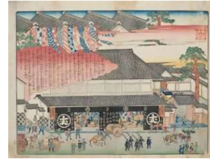
浮世絵師の小田切春江が描いた「有松絞 丸屋丈助店先」だよ！

岡家住宅は、かつて絞商を営んでいた建物です。主屋は有松でも最大級の規模を誇り、改造も少ない状況です。主屋の他に作業場、東倉や西倉などが建つ敷地全体の構成もよく残っており、市指定有形文化財に指定されています。