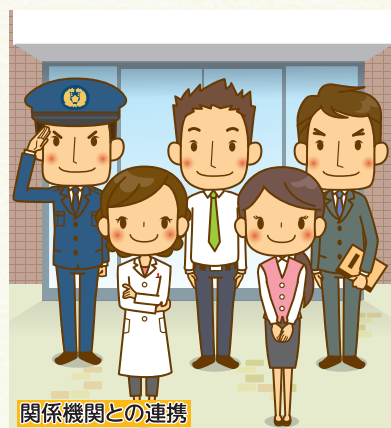
関係機関との連携