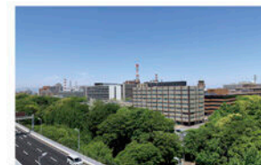
相談室からの風景

事前研修やフォローアップ研修などにより、子ども若者支援に関するマインドやスキルを学んでいます。