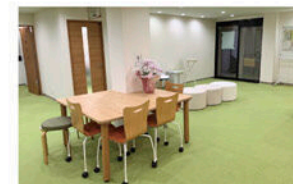
金山ランチ待合ロビー