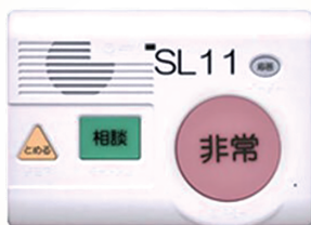
あんしん電話機(据置型)