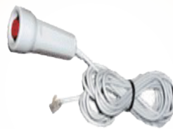
有線非常押しボタン (希望者のみ)