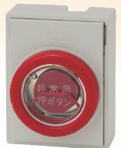
有線火災押しボタン

○あんしん電話機の設置には、2か月程度かかります。○無線ペンダントや携帯型あんしん電話機の