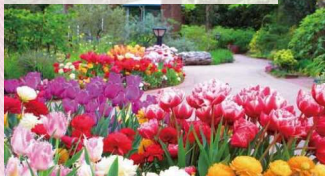
春のウォーターガーデン