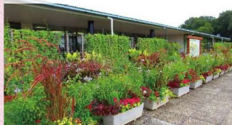
公園会館前花壇及びプランター