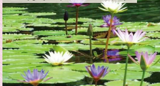
夏のウォーターガーデン