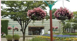
ガーデンプラザ前ハンギングバスケット