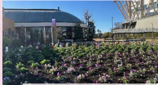
フラワープラザ（IGアリーナ前）