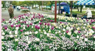
ガーデンプラザ前三角花壇