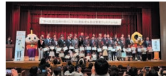
(防災めり絵コンテスト)