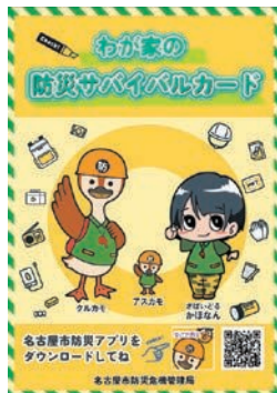
(防災サバイバルカード)