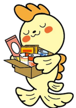
シャチのジュンちゃん