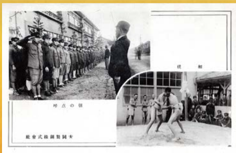
陸軍式銃操習 陸軍式銃操習

戦時下において、愛知県と名古屋市が防空防衛政策の重要な対象としたのは、綴「防空防衛費公債 昭和十五年度」に収録の市内地図に書き込まれた航空機関連工場と併設の私立青年学校でした。 三菱重工業や愛知時計電機の航空機工場の増設に加え、大同製鋼などの関連工場の増設、さらに住友金属工業などの進出によって、航空機関連工場は激増しました。これに伴い、少年工を確保するために私立青年学校の設立も相次ぎました。 ここから始まる「航空機名古屋」のあゆみについて紹介します。