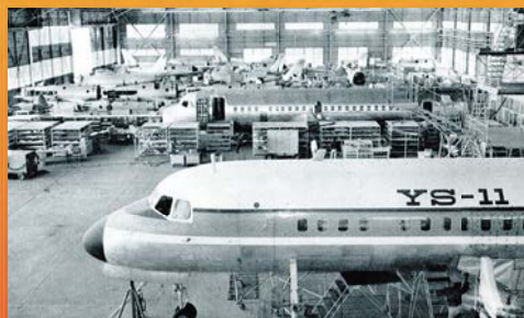
「小牧工場」 「新しい愛知 愛知県画報」