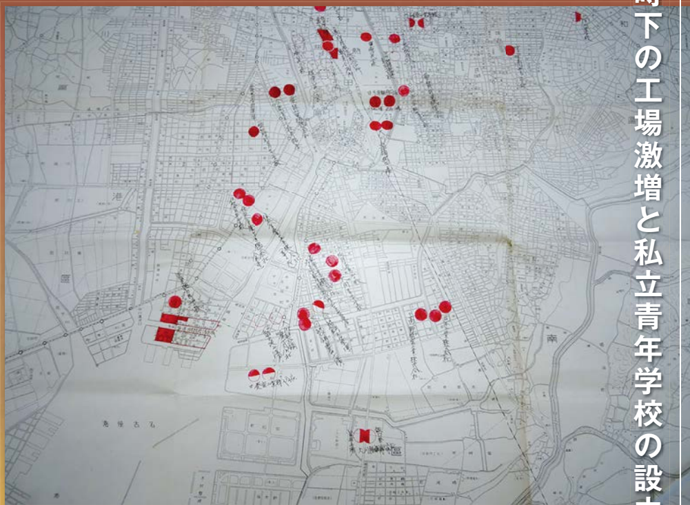
「航空機関連工場と併設の私立青年学校の位置図」 「防空防衛費公債 昭和十五年度」(名古屋市市政資料館所蔵)

戦時下において、愛知県と名古屋市が防空防衛政策の重要な対象としたのは、綴「防空防衛費公債 昭和十五年度」に収録の市内地図に書き込まれた航空機関連工場と併設の私立青年学校でした。 三菱重工業や愛知時計電機の航空機工場の増設に加え、大同製鋼などの関連工場の増設、さらに住友金属工業などの進出によって、航空機関連工場は激増しました。これに伴い、少年工を確保するために私立青年学校の設立も相次ぎました。 ここから始まる「航空機名古屋」のあゆみについて紹介します。