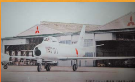
「F-86Fジェット戦闘機(国産第一号機)」