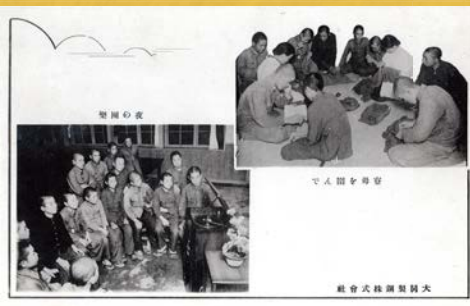
学園の夜 でん園を昇望 組合式銃操習