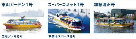
2階デッキあり 車椅子スペースあり