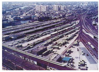
貨物駅時代(昭和53年)