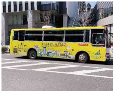
シャトルバス社会実験運行 (平成29年9月から令和3年3月まで運行)

協議会では、土地利用の方針と建築ルールを「ささしまライブ24地区整備方針」として取り決めているほか、良好な環境の維持・賑わいの創出・地域の価値向上などを目的に、地区内の定期清掃、広場の維持管理、イルミネーションイベントの開催、シャトルバスの社会実験運行など、さまざまなエリアマネジメント活動を実施しています。