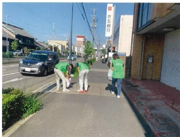
会社周辺の清掃活動