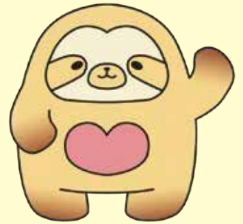
子どもの権利相談室 なごもっか マスコットキャラクター「なごもん」

名古屋市には、子どもの権利を守るための相談室「なごもっか」があります。「なごもっか」は、みなさんが自分の考えや思いを言えるように話を聞き、ともに考え、みなさんの気持ちを大切にします。