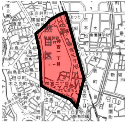
別表第 1（第 4条第 2号関係）