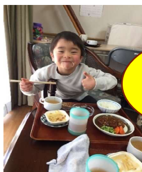
おいしいご飯 あります!