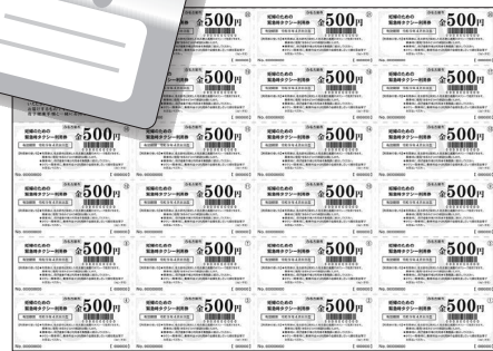
タクシー利用券(500円券の22枚綴り)