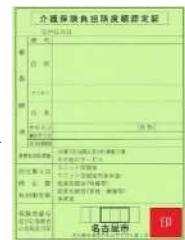
介護保険負担限度額認定証