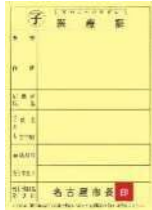
子ども医療証 障害者医療証 ひとり親家庭等医療証 福祉給付金資格者証

医療証等をお返してください。なお、手続きが必要な場合がありますので、担当窓口へおたずねください。 区民福祉課 052-875-2206 3階 9番窓口