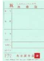
ひとり親家庭等医療証