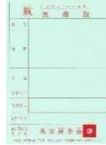
ひとり親家庭等医療証