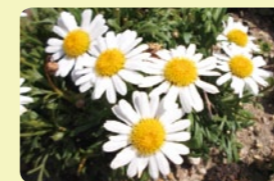
区の花：マーガレット

掲載内容は、「平成28年度 天白区区政運営方針」から抜粋したものです。詳しくは、下記HPにてご覧ください。