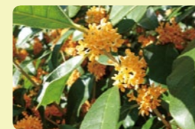
区の木：キンモクセイ

月曜日～金曜日 午前8時45分～午後5時15分まで (祝日・休日・年末年始を除く)