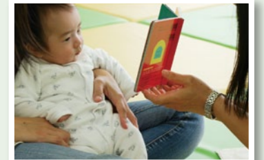
ブックスタート事業