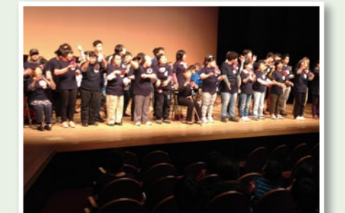
福祉と映画の集い