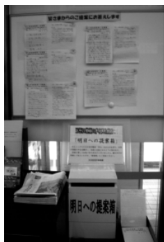
明日への提案箱と ▲お返事掲示板