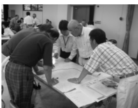
▲避難所リーダー養成講座