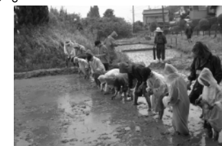
▲荒池こども森づくり(田植え)