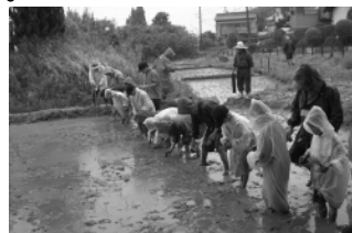
▲荒池こども森づくり(田植え)