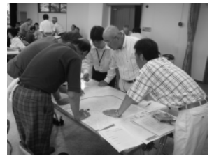
▲避難所リーダー養成講座