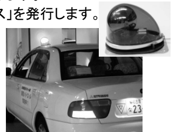
▲青色防犯パトロール