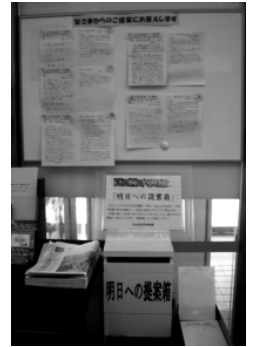
明日への提案箱と ▲ お返事掲示板