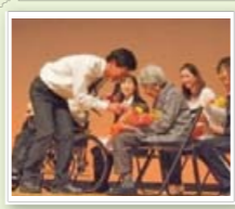
みんなの元気フェスタ (旧「介護フェスタ」)