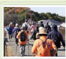
てんぱく健康づくり隊