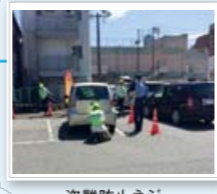
盗難防止ネジ 取り付けキャンペーン