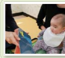
ブックスタート事業