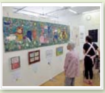
顔の見える アート展てんぱく