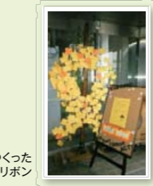
来庁者のメッセージでつくった オレンジリボン