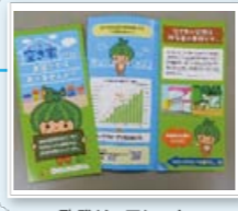
啓発リーフレット