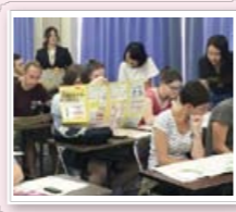
留学生ガイダンス