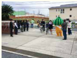
自転車安全利用促進キャンペーン