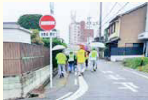
まち歩き(防犯パトロール講習会)