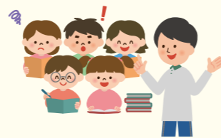
おやこ子育て広場