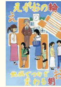
青少年すこやかポスター