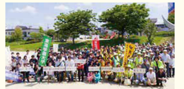
天白区クリーンウォーキング 2018