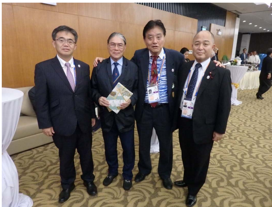
左から 大村愛知県知事、フォック OCA 副会長、 河村名古屋市長、福田名古屋市会副議長

大村知事、河村市長及び福田名古屋市会副議長が、7 月に愛知・名古屋を訪れた OCA 評価委員会の全委員 (5 名) と会談し、改めて、訪問及び第 20 回アジア競技大会の開催地として高い評価をいただいたことに対し謝意を伝えた。