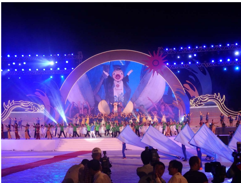
第 5 回アジアビーチゲームズ開会式の模様

大村知事、河村市長及び福田名古屋市会副議長が、開会式に出席し、日本代表選手団に声援を送るとともに、大村知事が、開会式に出席していたグエン・スアン・フック・ベトナム社会主義共和国首相と面会した。