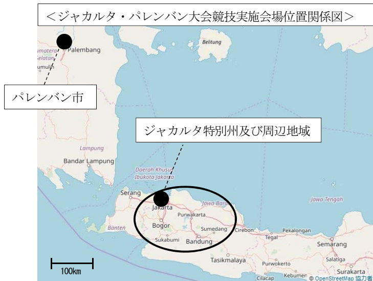
<ジャカルタ・パレンバン大会競技実施会場位置関係図>

参加者数：選手11,300人 役員5,800人 メディア11,000人 ボランティア13,000人 ※OCAホームページより抜粋