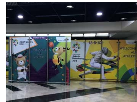
① 空港（左：アクセディテーションセンター 右：歓迎装飾）