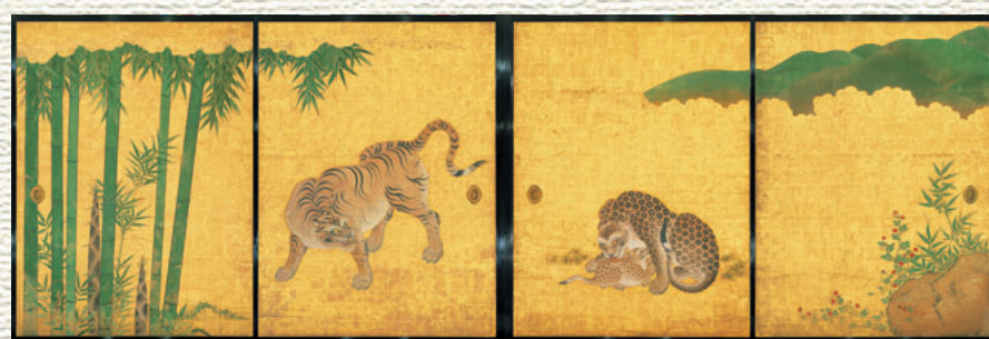
玄関一之間東側襖絵(竹林豹虎図)