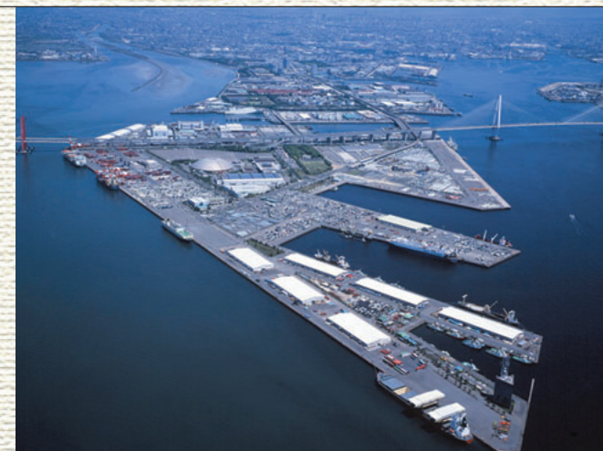
検討対象地：金城ふ頭