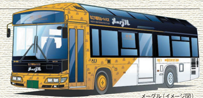
メーグル(イメージ図)