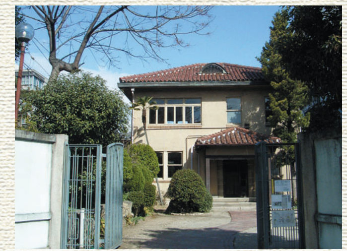
文化のみち 桐木館

都市個性の発信、産業観光・産業振興、人材育成を目的とし、「モノづくり文化」を発信・継承するモノづくり文化交流拠点構想を推進します。