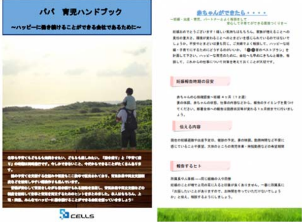
【パパ 育児ハンドブック】