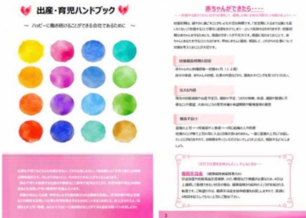
【出産育児ハンドブック】