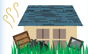
景観・衛生環境の悪化