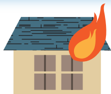
放火による火事・火災