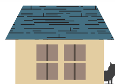
不審者(動物)の侵入