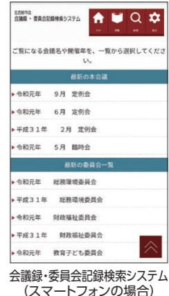
会議録・委員会記録検索システム(スマートフォンの場合)