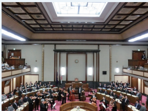
昨年のコンサートの様子

日時 令和2年2月19日(水) 午前10時30分から 場所 名古屋市会本会議場(市役所本庁舎) 演奏曲目 ウィリアム・バード/ オックスフォード伯爵のマーチ ほか 応募方法 往復はがきに希望人数(2人まで)・全員の住所・氏名・電話番号を記入し、市会事務局総務課(〒460-8508)までお送りください。(郵便番号と局・課名のみで届きます。) 令和2年1月17日(金)消印有効 お問い合わせ 市会事務局総務課 TEL 972-2083 その他 入場無料。応募者多数の場合は抽選。(複数枚の応募は無効となります。)