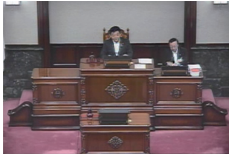
インターネット中継 視聴画面

本会議・常任委員会・特別委員会は、インターネットで生中継と録画中継(過去1年分)を行っています。なお、パソコンのほか、スマートフォンやタブレット端末でも視聴できます。