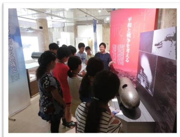
① 250 キロばくだんを見学しました