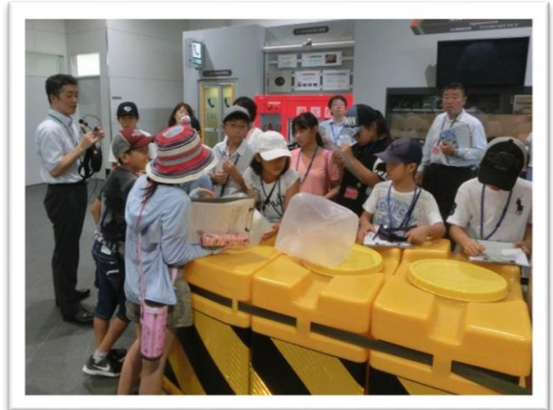
① 高速道路にある設備や機器を見学しました