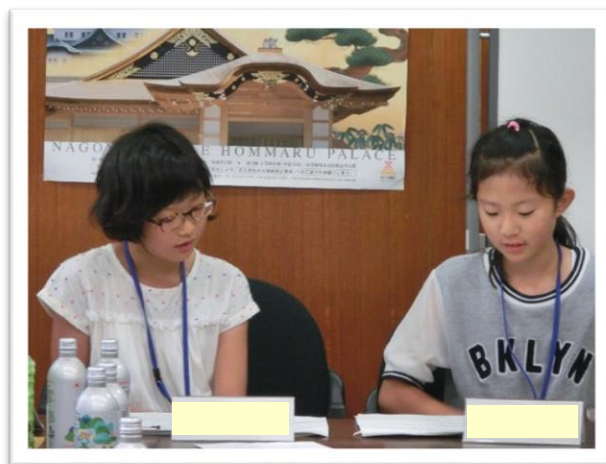
① 司会を行う委員長と副委員長

名古屋城 じょう は、建物や庭園等の公開、重要文化財などの所蔵資料 しよぞうしりょう の展示 てんじ しています。今年の6月に、本丸御殿 ごてん が完成公開されました。