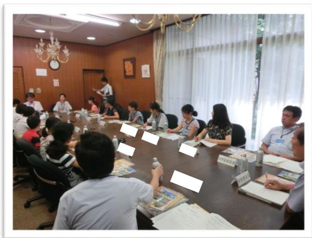
① 名古屋城 じょう の説明を聞きました