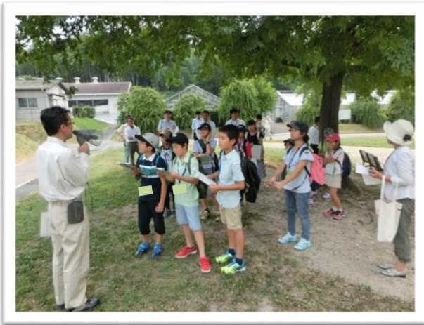
① 農業センターの説明を聞きました