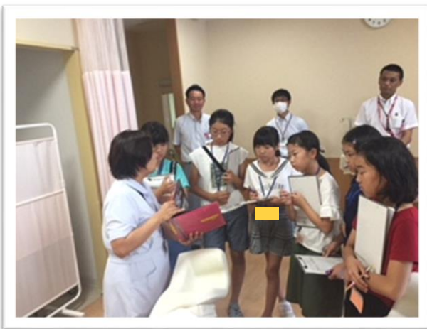
① 周産期医療センターを見学しました