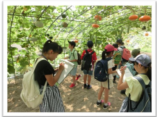
① ヒョウタンとカボチャのトンネルを歩きました