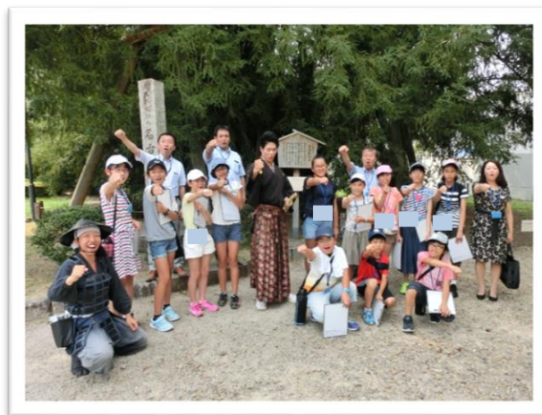
① おもてなし武将隊 ぶしやうたい に会いました