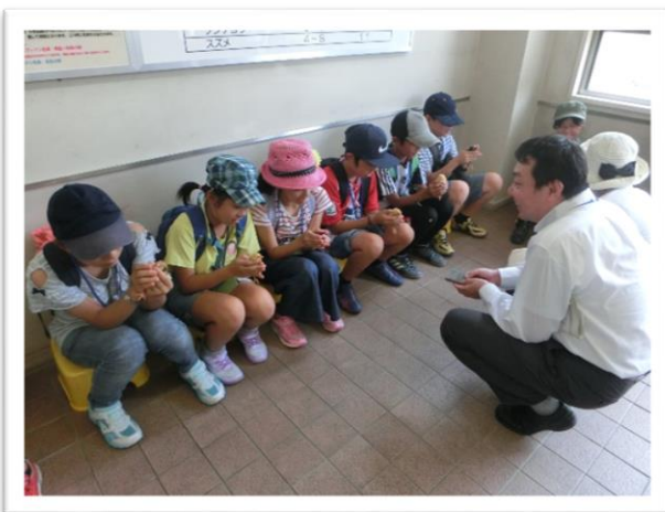
① ひよこことのふれ合いを体験しました