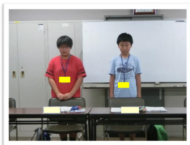
① 司会を行う委員長と副委員長

愛知・名古屋 戦争に関する資料館は、戦争に関する実物資料の展示を行い、戦争の教訓や平和の大切さを学ぶことができます。