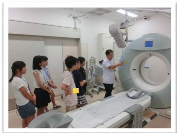
① CTなどの医療機器を見学しました