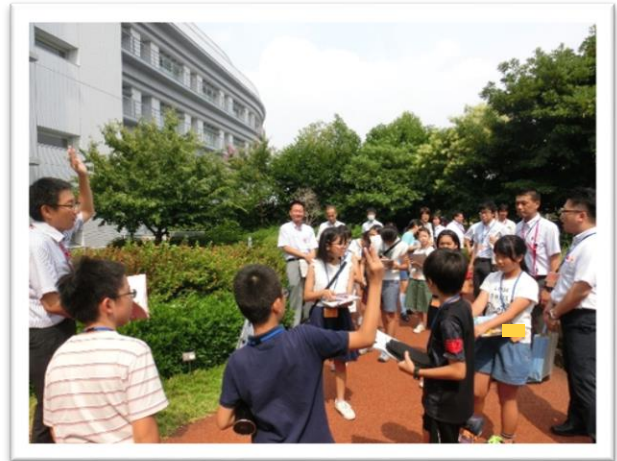
① ひだまりの丘を歩きました