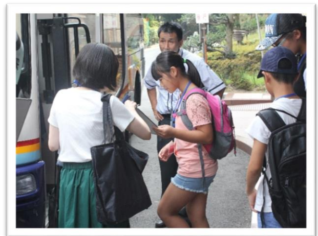
①施設見学に出発する子ども議員①