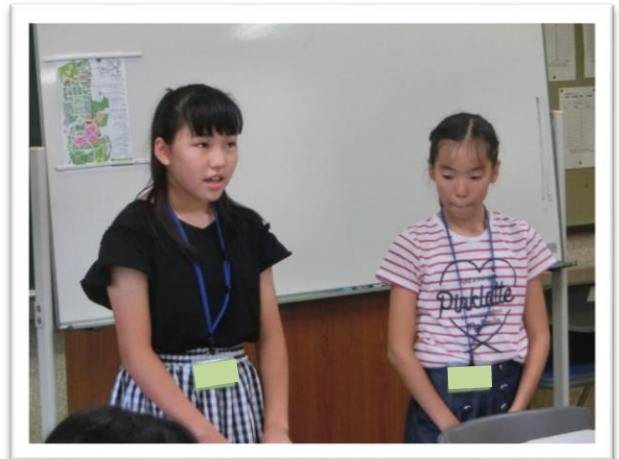
① 司会を行う委員長と副委員長

農業センターは、「野菜」と「ちく産」がテーマの農業公園で、農業に親しみながら、ゆったりと憩うことのできる施設です。