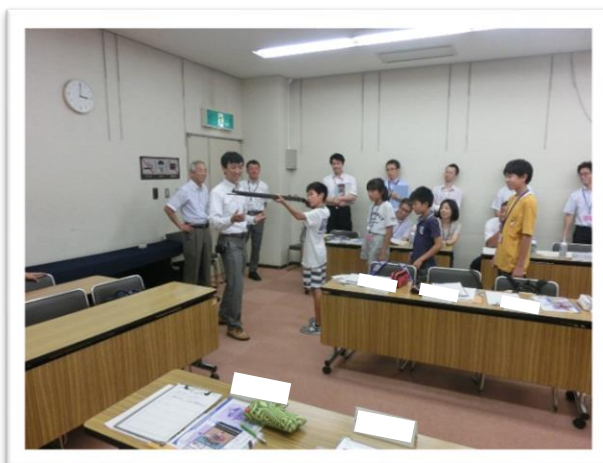
① 本物の火なわじゅうにさわりました