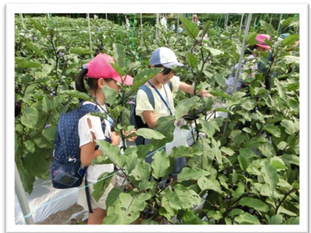
① ナスの収穫体験を行いました