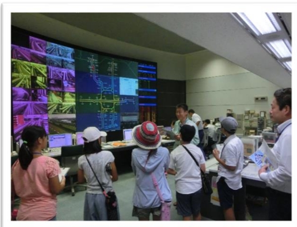
① 交通管制室を見学しました