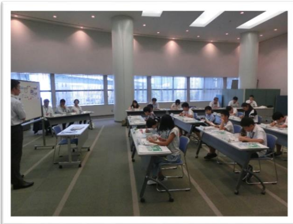
① 名古屋高速道路の説明を聞きました