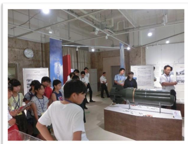
① 集束焼いだんの説明を聞きました