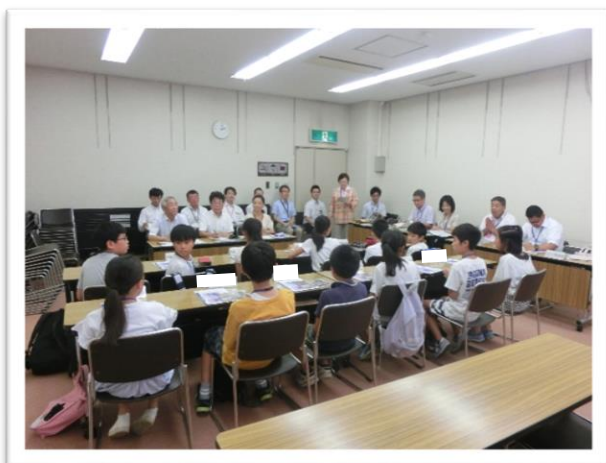
① ひでよしきよまさ 秀吉清正記念館の説明を聞きました