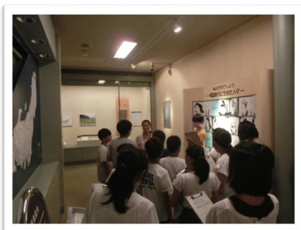
① ひでよし きよまさ 秀吉と てんじしりょう 清正に関する展示資料の説明を聞きました①