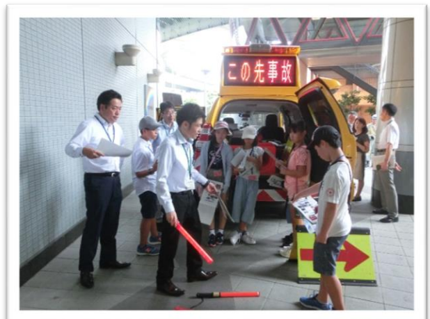
① 道路パトロールカーの装備やとうさい品について説明を聞きました