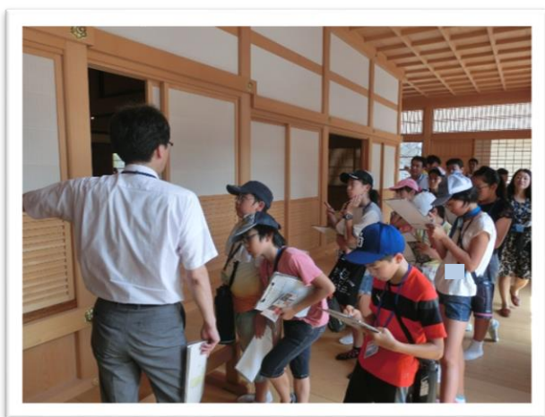
① 本丸御殿 ごてん を見学しました