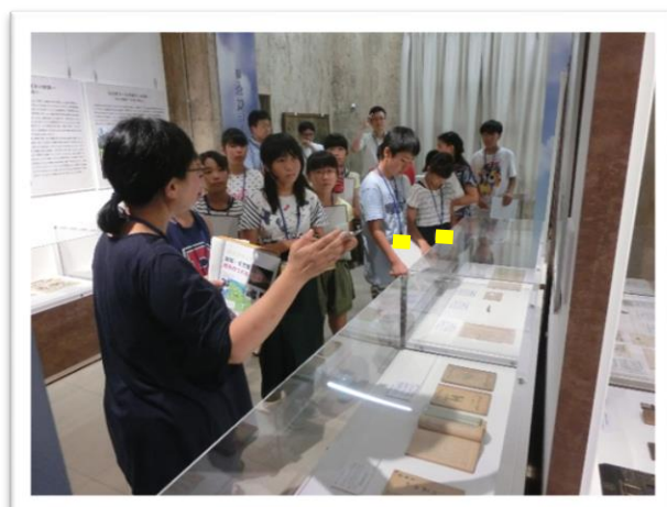
① 戦争に関する資料の説明を聞きました