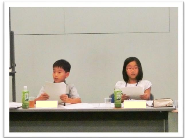
① 司会を行う委員長と副委員長