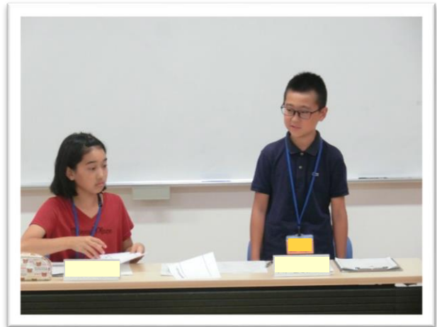
① 司会を行う委員長と副委員長