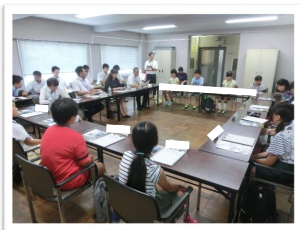
① 愛知・名古屋 戦争に関する資料館の説明を聞きました