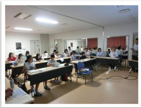
① 西部医療センターの説明を聞きました