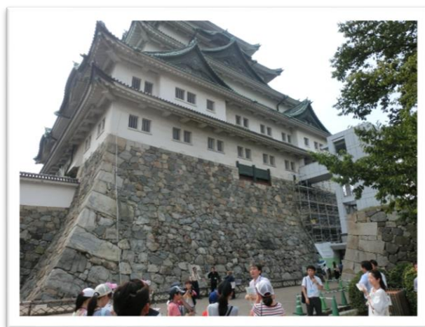
① 天守閣 てんしゅかく を外から見ました