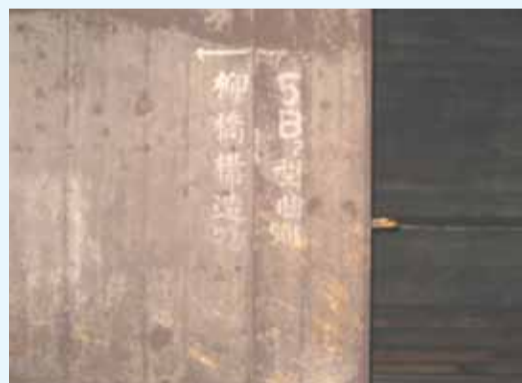
トンネル内の「柳橋構造物」の標記

答弁 柳橋には市場があり、堀川から名古屋駅、四間道のあたりまで含めたところに世界に冠たるグルメ天国をつくりたい。新駅の設置はまちづくりの起爆剤になる。ちゃんと投資しないといけない。来年度にも、新駅について具体的な調査の予算を立てたい。(河村市長)