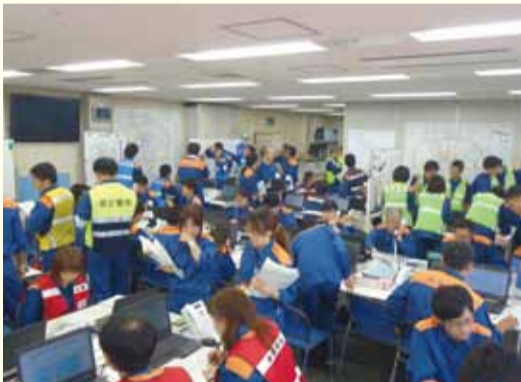
災害対策本部(情報センター)の様子

答弁 災害対策本部の体制強化は早期に解決すべき課題であり、東庁舎を中心とした既存施設の有効活用も視野に入れ、適切なスペースを確保できるように、スピード感を持って取り組んでいく。(防災危機管理局長)