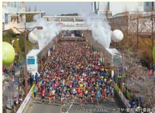
マラソンフェスティバルの様子

答弁 本市におけるスポーツ施策は教育委員会事務局が所管し、全庁的にスポーツ推進に取り組んでいる。今後も市長部局と教育委員会事務局との連携を一層密にし推進に取り組むが、まずは他都市の実情を調査したい。(新聞副市長)