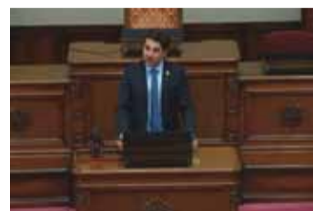
アルノー・ロビネ ランス市長

☞ 議場での歓迎式の様子についても、録画中継を視聴できます。([本会議中継]の「平成29年10月20日 ランス市長一行歓迎式」から視聴可)