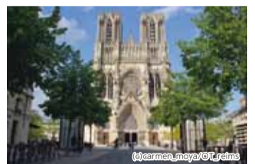
ノートルダム大聖堂