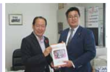
右:橋本ひろき 名古屋市会副議長 左:戸羽 太 陸前高田市市長

10月17日、橋本ひろき副議長が岩手県の陸前高田市を訪問し、8月5日の「なごや 子ども市会」本会議で採択された陸前高田市子どもたちへのメッセージを届けました。